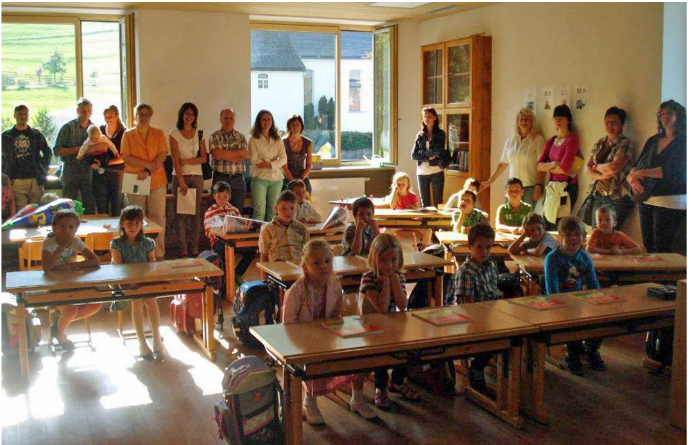
Beim ersten Schultag wurden die Erstklässler von ihren Eltern begleitet.