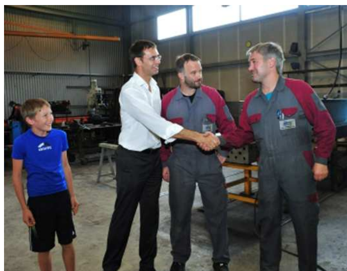
... und die Firma Helbock Landtechnik- und Metallverarbeitungs GmbH.