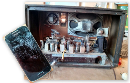
Alte und moderne Elektronik im Reparatur-Café.

Russmedia aus Schwarzach ermöglicht uns, das derzeit schnellste Internet in Riefensberg verfügbar zu haben (100 Mbit/sec). Wer diese