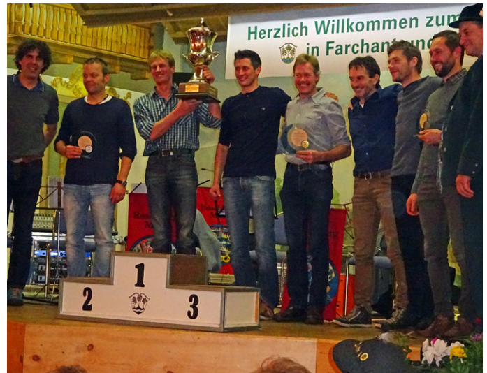
Das Langlauf-Team bei der Siegerehrung.

Der Alpencup ist ein Wettbewerb für amtierende Bürgermeisterinnen und Bürgermeister sowie amtierende Ge-