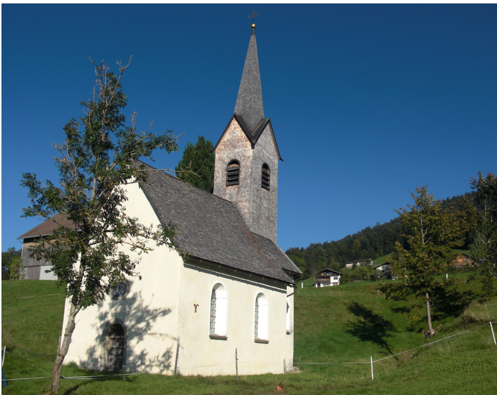
Die St.-Anna-Kapelle in der Parzelle Fischer.