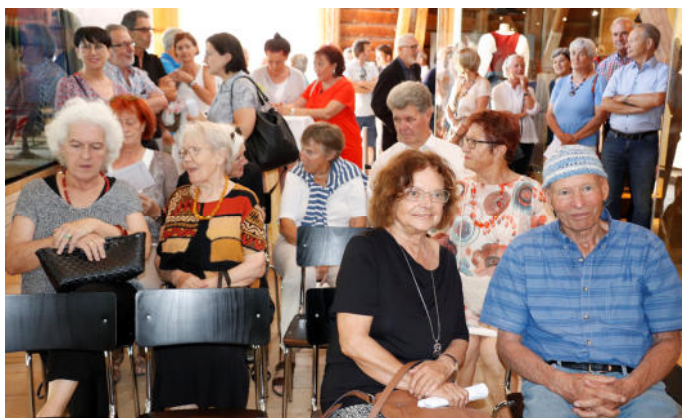
Zahlreiche Gäste folgten der Einladung zur Vernissage.