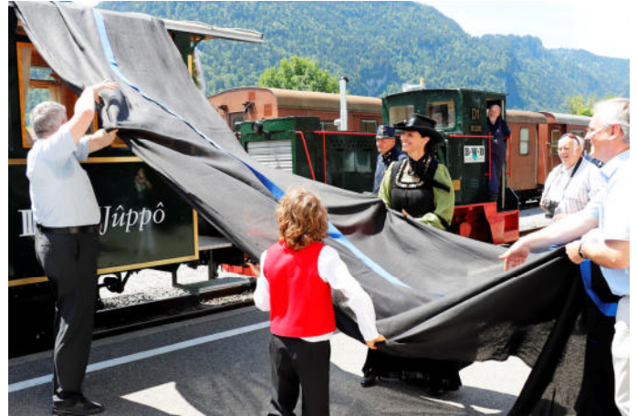
Der Jüppôwaggon war mit acht Meter Juppenstoff verhüllt.