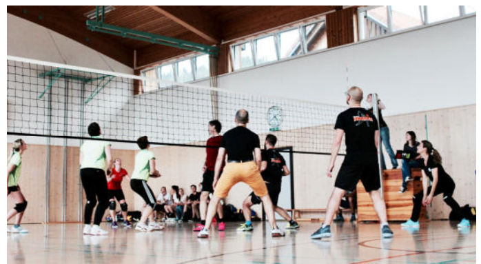
Um Platz 3 spielten „Grusele guat“ aus Au gegen die Dornbirner Mannschaft „Smashing Pumkins“.