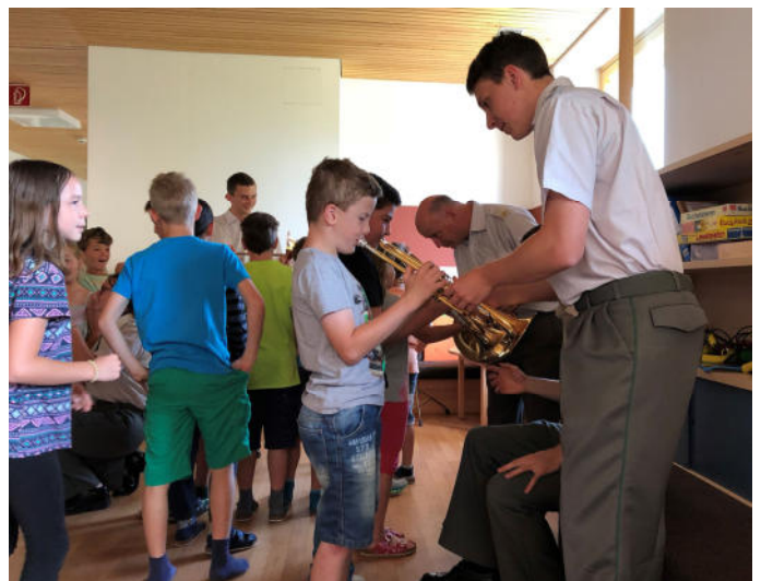
Die Förderung des Nachwuchses ist dem Musikverein Riefensberg ein großes Anliegen.

Ihr abwechslungsreiches Programm begeisterte Kinder und Lehrer gleichermaßen und brachte eine schöne Abwechslung in den Schulalltag.