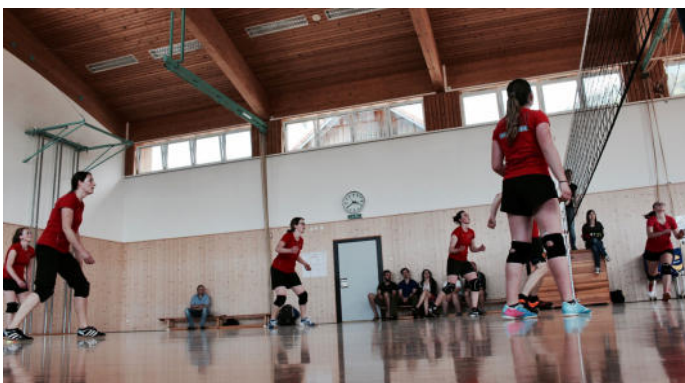
Die Riefensberger Teams „Duranand“ und „Rescht vom Fescht“ spielten um Platz funf.