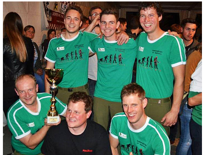
Der Erfolg wurde gebührend gefeiert.