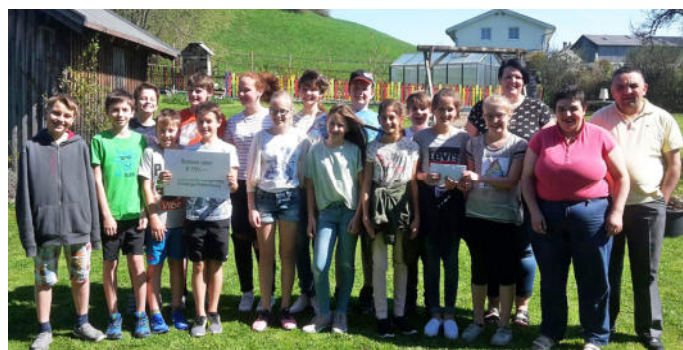
Den Gesamterlös der Zopfhasen-Aktion übergaben die Firmlinge an die Lebenshilfe in Langenegg.

Eindrücke von der Firmung am Pfingstsonntag.