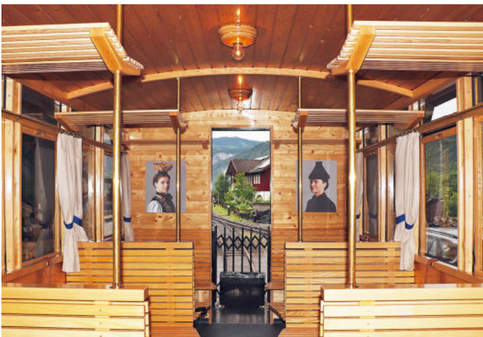
Der neue Themenwagen rückt die Juppe ins Rampenlicht.

Die Juppenwerkstatt und der Verein Bregenzerwaldbahn-Museumsbahn sind sehr glücklich über die Kooperation und werden auch zukünftig im Rahmen von Tagesangeboten eng zusammenarbeiten.