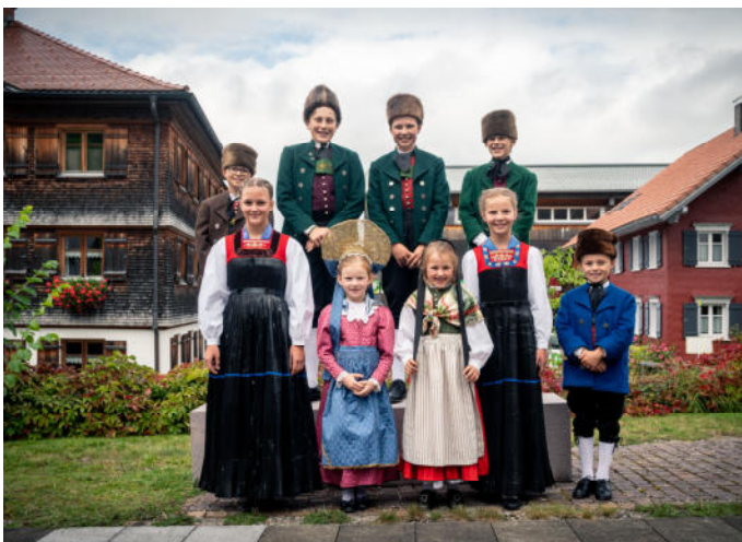
Auch die junge Generation trgt gerne Tracht.