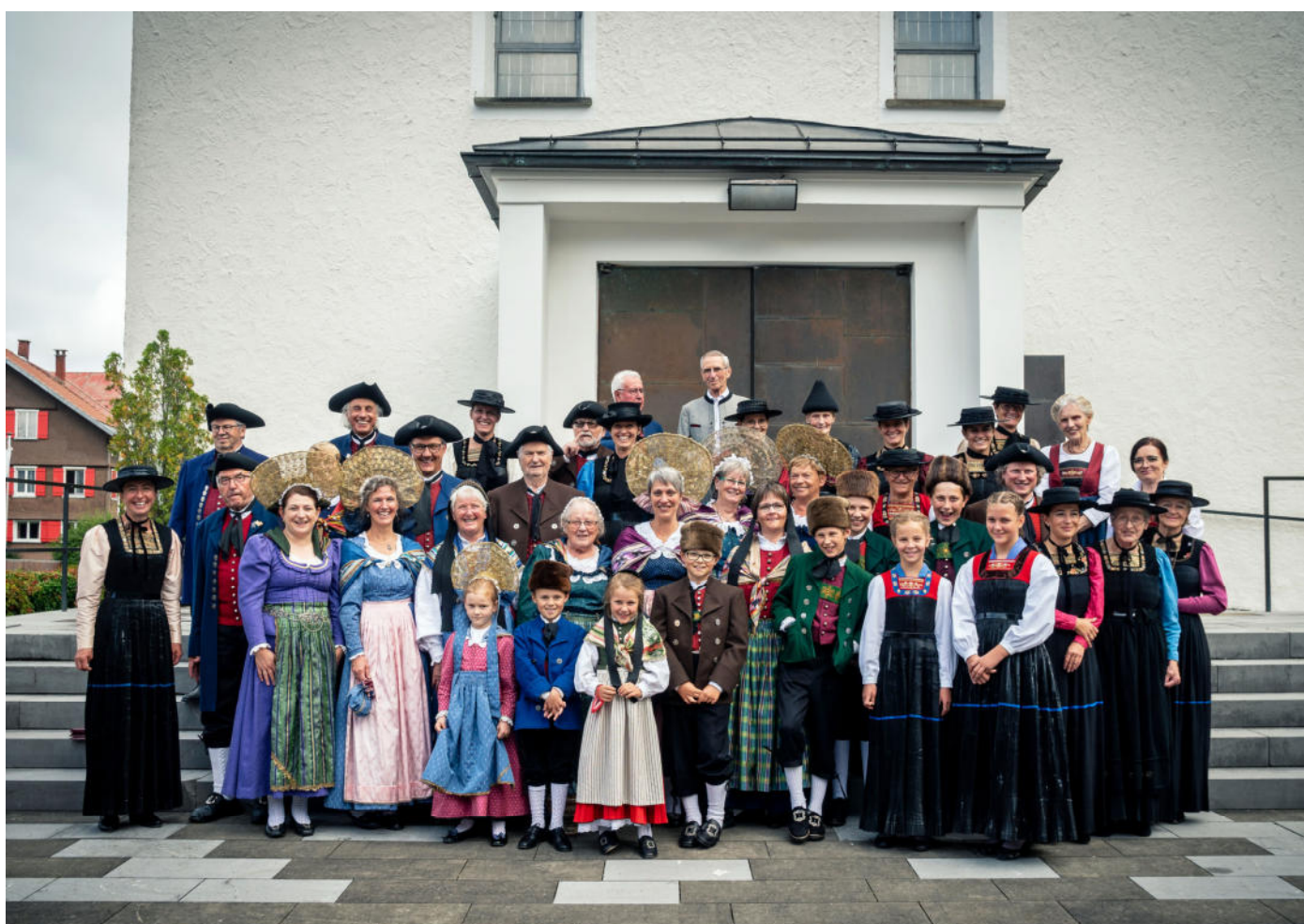
Trachtenträger*innen aus dem Bregenzerwald und aus Schwaben beim Bregenzerwälder Trachtentag.