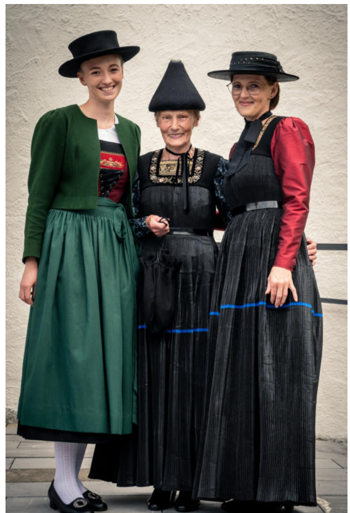
Drei Generationen in Tracht.