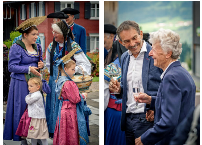
Bei der Agape wurde das gesellige Beisammensein genossen.

Bei der anschließenden Agape auf dem Kirchplatz genossen Besucher*innen wie Einheimische das gesellige Beisammensein. Musikalisch umrahmt wurde die Agape vom Musikverein Riefensberg, der auch den „Tag der Blasmusik“ feierte, sowie dem Chor der Trachtengilde Riedlingen. Mit einer ffentlichen Fhrung durch die Juppenwerkstatt am Nachmittag ging ein wunderbarer 9. Trachtentag zu Ende.