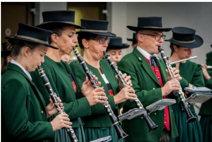
Der Musikverein umrahmte den Trachtentag musikalisch.