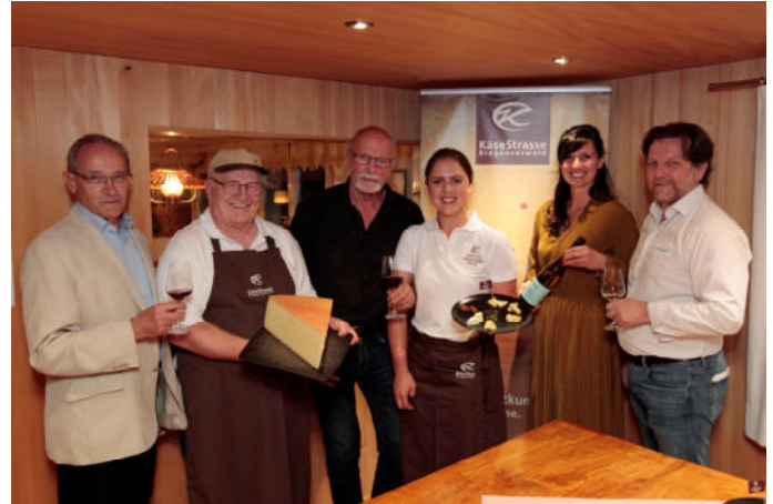
Das Organisationsteam stoß auf den gelungenen Abend an.

Der gemütliche Ausklang fand in der ehemaligen Krone statt, bei dem den Gästen weitere Käse- und Weinproben angeboten wurden. Herzlichen Dank an Josef Dorn für die Gastfreundschaft!