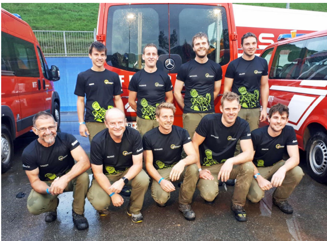
Gratulation an das Team 1 der Feuerwehr Riefensberg zur tollen Platzierung!

Wir sind überwältigt, dass trotz Kälte und Dauerregen so viele Riefensberger*innen von jung bis alt nach Alberschwende gekommen sind, um uns anzufeuern! Vielen, vielen Dank für eure tolle Unterstützung!